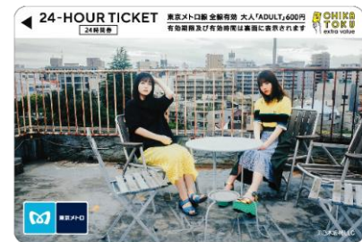
「春夏秋冬/フォーシーズンズ 乃木坂46」東京メトロオリジナル24時間券（イメージ）